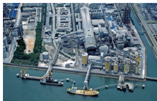
麻生セメント 苅田工場